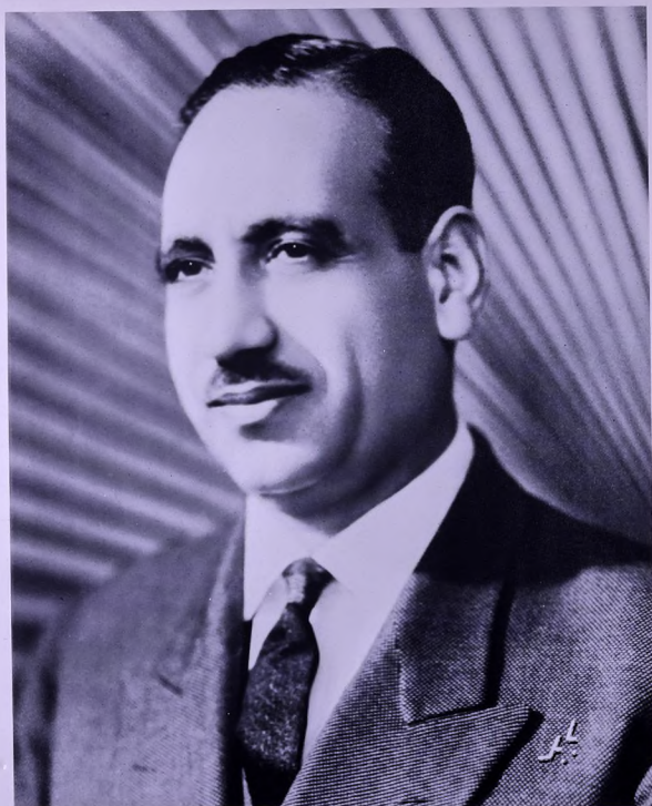
السفير الامريكاني في بغداد الجنرال جوزيف موريسون في بغداد العراقية