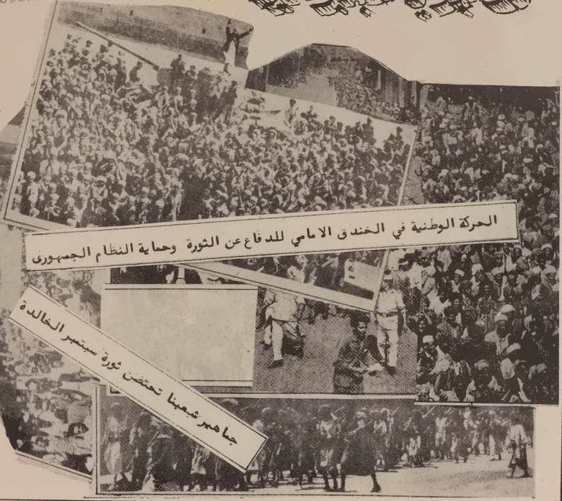
الحركة الوطنية في الخندق الامامي للدفاع عن الثورة وحماية النظام الجمهوري