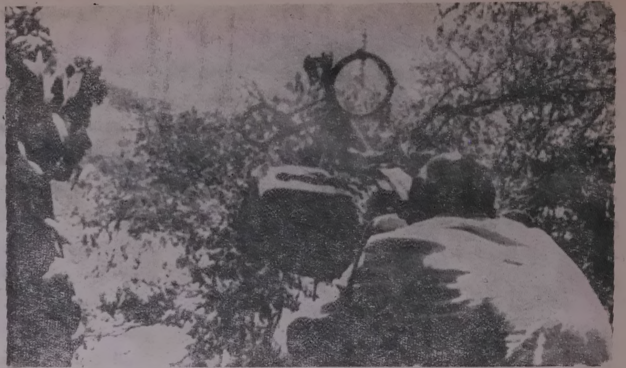
الشكل النضالي الحاسم في صراعنا مع اعداء حرية شعبنا

يلقي النضال البطولي الصامد الذي تخوضه جماهير شعبنا بقيادة اداة النضالية الجبهة الشعبية لتحرير عمان ، وخاصة الكفاح المسلح الذي تشنه قوات جيش التحرير الشعبي ضد الغزاة الايرانيين والمستعمرين البريطانيين ومرترقة العميل قابوس ، يلاقي هذا النضال التأييد والاهتمام من قبل القوى المحبة للحرية والسلام والمعادية للاستعمار والرجعية ، وخاصة قوى المعسكر الاشتراكي .