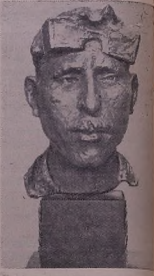
Бекасе н'але н'өв'эчылна Шькөл е некөл'г'арэ Х. Исханяианн.

армонна вөбу. Виставан хатыно данине шыкьлэд өв'өр'өлд ед шыкьл'өшөд өв'өр'ө н'айы манур.