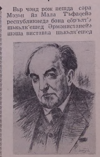
Ав. Исханяиан Шьма'тэ'ейн Бр. Рухияниан.