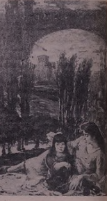
Жь э'мьре майн рөжө Шькөл'е А. Авестиян