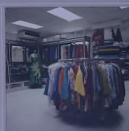
تصاميم من المصنع التي شارك في إجراء المسح

أن هذا الدور هو مسؤولية المؤسسات ذاتها إلا أن أحد المستثمرين من ذوي الآراء يرى أن نجاح أعماله يتوقف عليه شخصياً، حيث قال .. ( لقد قامت الهيئة الملكية الجبيل وبيع بدأت فور كبير في تطوير مدينة الجبيل الصناعية ومساندة عمليات الاستثمار التجاري .. وقامت أيضاً بإنشاء التجهيزات الأساسية بالمدينة ولا أعتقد أنه ينبغي أن نترقب منها أن تفعل أكثر من ذلك ) .