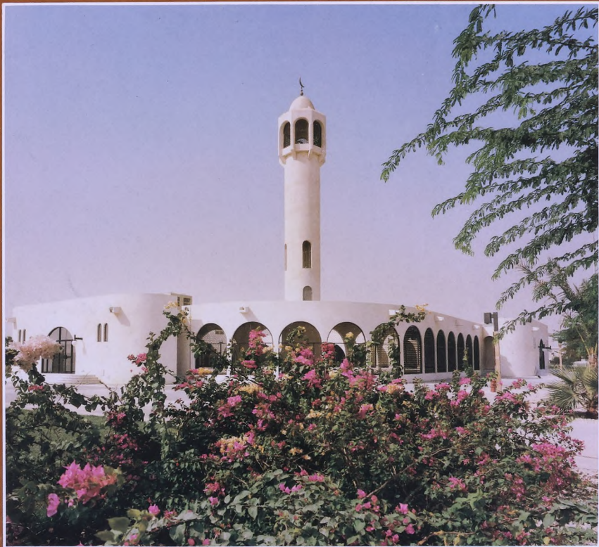
أحد المساجد في مدينة الجبيل الصناعية

لمزيد من المعلومات يرجى الإتصال بالعنوان التالي :