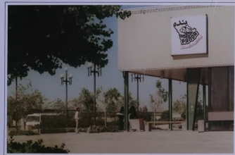
(على) صيدلية حديثة بمركز حارة الباسمة (الصفا) مركز بندي التسوق بحي الفراق

حصلت عدة مؤسسات على مرافقة الهيئة الملكية لتأجير أراض ومرافق تجارية بمدينة الجبيل الصناعية .. وتشمل هذه المرافق مشتلًا زراعيًا، ومطعم، وشركة تعاونية للمواد الغذائية، ولزالات الفارشات مستمرة مع مؤسسات آخرين فيريان في إقامة مستوصف خاص ومرفق للتدريب على مكافحة الحرائق .