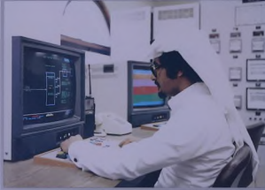
مركز الرقابة بالهجزان الآلي في وحدة معالجة المياه الجاري الصعبة بمدينة الجبيل الصناعية

ويتم إلقاء النفايات غير الخطرة القابلة للتحلل الصحي في منطقة الإزالال الخاصة بها وتغطي بطبقة من الرمال بإرتفاع متر عن السطح . أما النفايات الجامدة فتتعبث في موقع التخلص الخاص بها وتغطي بكمية قليلة من المواد الطبيعية، في حين يمكن الإستفادة من النفايات الهامدة التي تصلح لإشاعات الطرق والرميات .