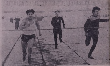
Шьмаэ-та шагәр тед мак'тәбед Ереванейә спорте вәхте ләтце стадиона республикае.

Паше митингада президент Сукарно хәбарда. Эви раибуна х'во гот бона we йәке, вәки әже програме п'ае шьмаэ-та Индонезийәе п'ар' х'вай д'во. (ТАСС).