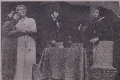
Шывкыда: — К'ома театрийёе хвэ'офрандыне вахте шер бандыне.

Она вод'оню дёрже, ваки г'омамия шабьяле нёйндё Талине һазри фестивала шабьялейо й'эмт'ыфачие дэбьне. Тэрже бы готыне, ваки башч'о готи рынд һазыр дэво к'ома театрийёе маза культура марк'эза нёйндё Талине. Ве к'ома салыбе зэдэлыр, ваки һазри фестивале дэво у гоме нава сала 1956-да ле гюнд нёйндё дэво иншадандына г'ык пьесед т'эза у бер колхозване нёйне 45 шара шалда һатийё. Ван рожка к'ома театрие пешда һат бер хобатк'ар марк'эза нёйне. Сары маза культура бы г'омашарына г'ык жи бу, ве рожке һатар иншадандыне пьеса к'ома Шамкометийё «Мала гонч'ар» (Кор'адо). Сар дэке те к'ыше э'рде пьесэ Кор'адо, рола