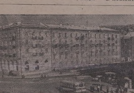
Же форт'та ПК Армистанетей 22-а Натван форт'та 23-а...