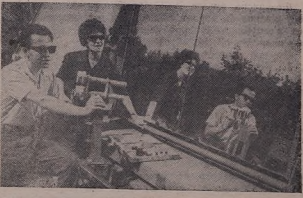
РСС Армистанетей. Ойлетед поминере бар р'адикете тавъе 10...